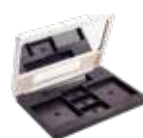
Boîte à Couleurs Seulement Combo : 32USD | 41,50CDN #30102