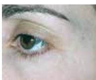
APRÈS 28 JOURS