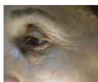
APRÈS 56 JOURS