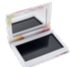
Compact Bento De Beauté Seulement 24,99USD | 32,50 $ CDN #21001